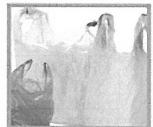
MŰANYAG SZATYOR: EGYSZERHASZNALATOS, VOLT HIPERMARKETES