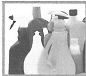
MŰANYAG FLAKONOK: TUSFÜRDŐS, MOSÓSZERES, OBLÍTÓS