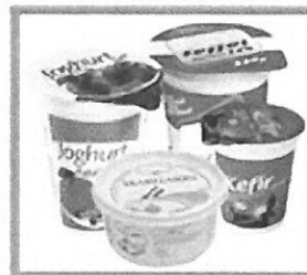
MŰANYAG FLAKONOK: TEJFŐLÓS, JOGHURTOS, VAJAS