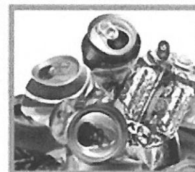
ALUMÍNIUM ÜDÍTŐITALOS ÉS SÖRÖS DOBOZOK