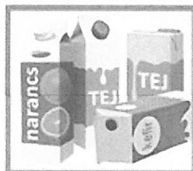
ITALOS KARTONDOBOZOK: TEJES, GYÜMÖLCSLÉS LAPITVA, KIÖBLITVE