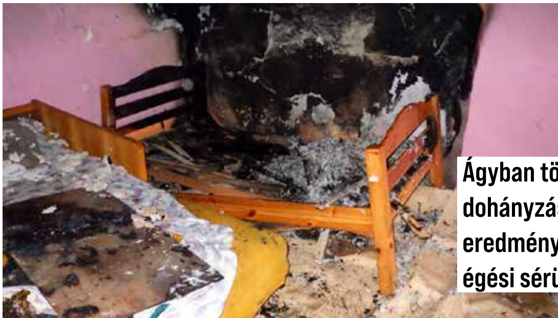
Ágyban történt dohányzás eredménye 2 fő égési sérüléssel