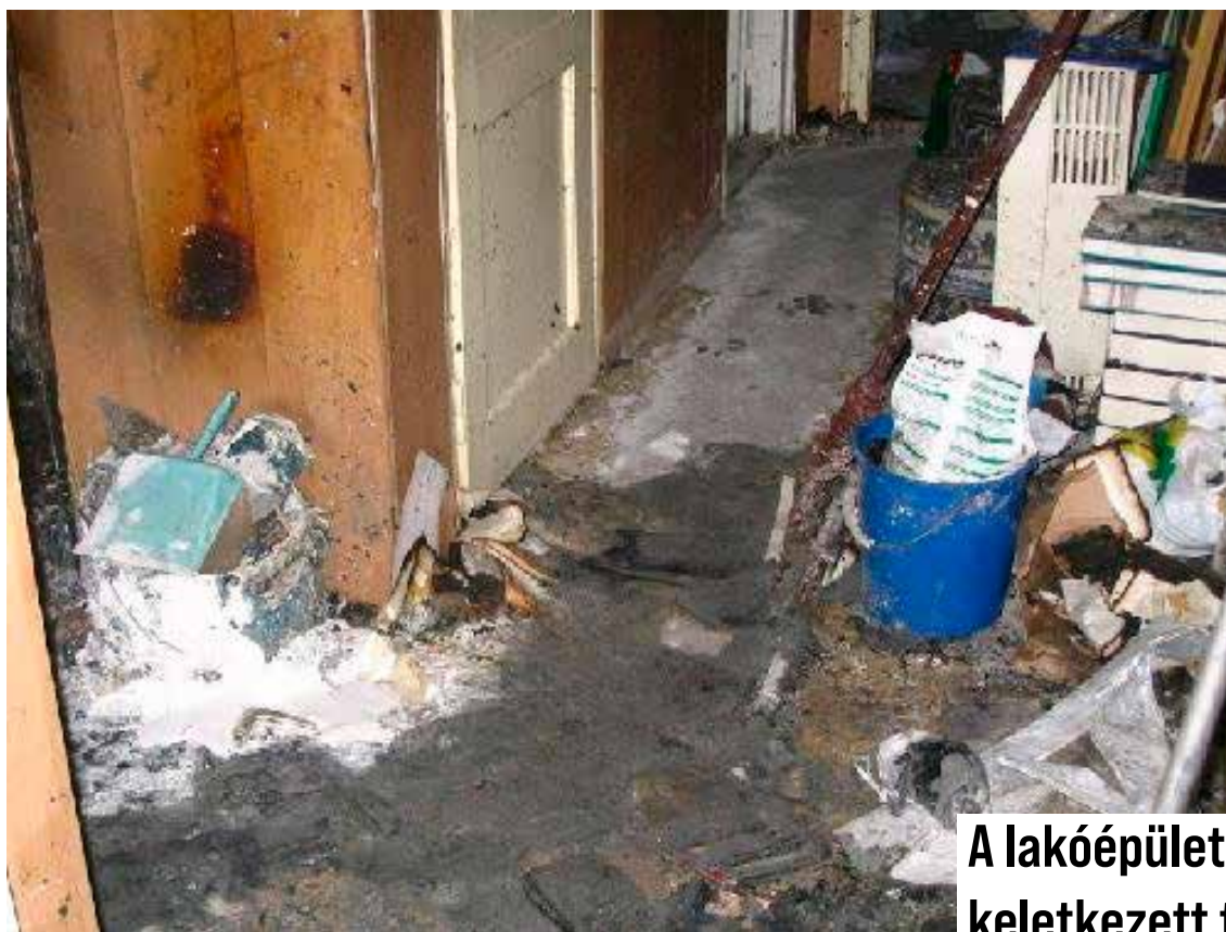
A lakóépületben keletkezett tűz a közlekedő és szoba helységben