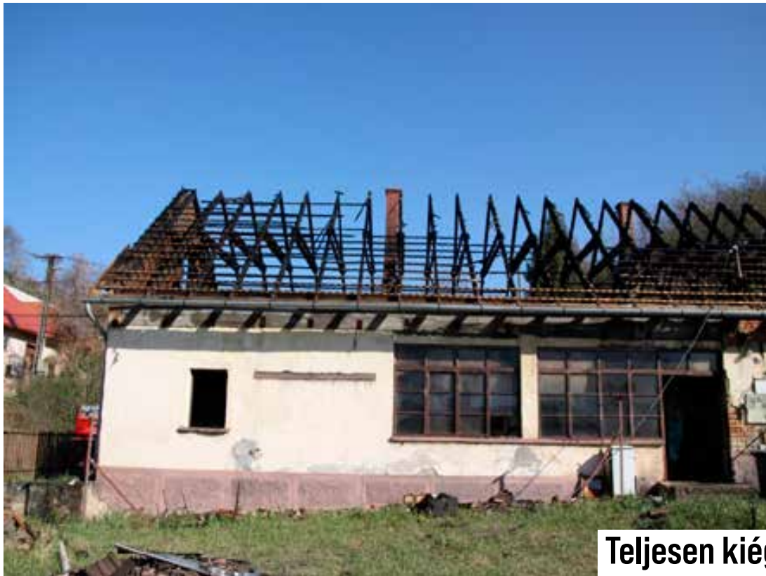
Teljesen kiégett és leégett lakóépület