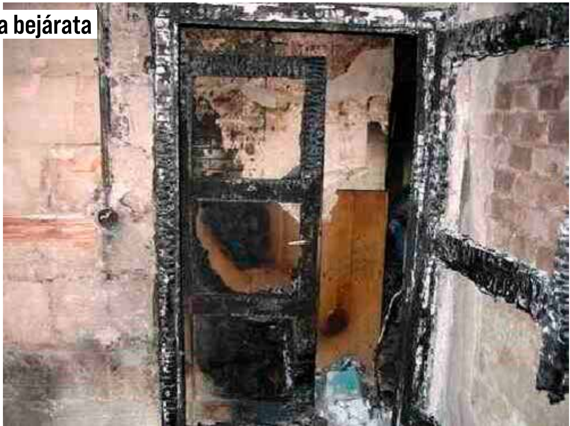
...és a bejárata